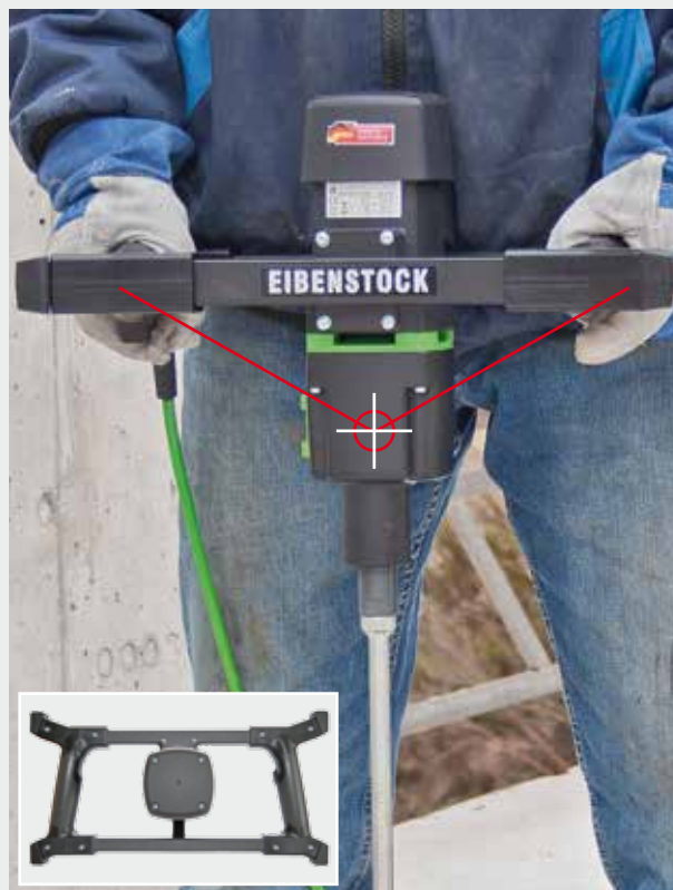
Largo, trapézio, alças ergonômicas e centro de gravidade equilibrado - Guia fácil e bem equilibrado da máquina para maior alavancagem