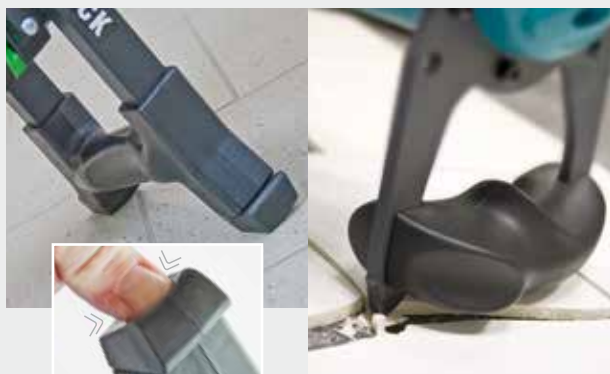
Elementos de amortecimento e proteção em poliuretano - proteção da máquina e da superfície em caso de queda não intencional