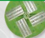
Disco para raspar e raspar (para reboco mais duro)