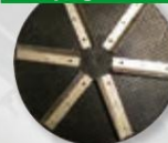
disco de raspagem (para gesso mais macio)