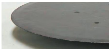
H2809741846 - Prato de alisamento plano