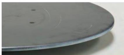
664255 - Placa de alisamento com borda de 90°