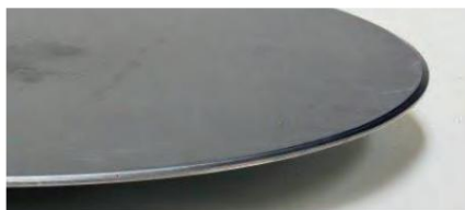
655127 - Placa alisadora biselada